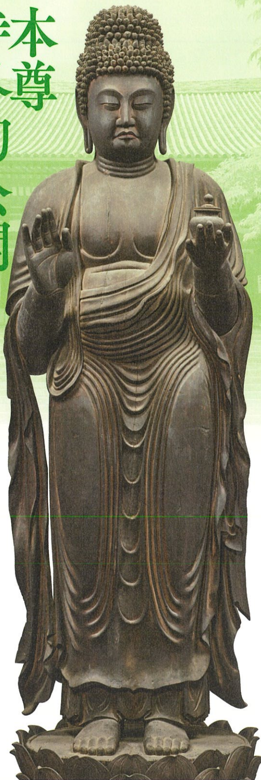
国宝 薬師如来立像 平安時代・8～9世紀 通期展示

京都北郊の紅葉の名所、高雄の神護寺は、和気清麻呂が建立した高雄山寺を起源とします。唐から帰国した空海が活動の拠点としたことから真言密教の出発点となりました。本展は824年に正式に密教寺院となった神護寺創建1200年と空海生誕1250年を記念して開催します。空海ゆかりの宝物をはじめ、神護寺に受け継がれる貴重な文化財をご覧ください。