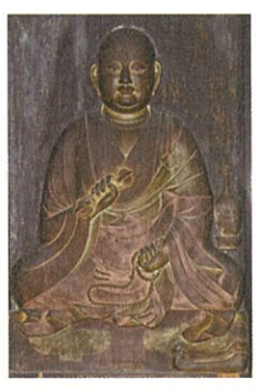
重要文化財 弘法大師像 鎌倉時代・14世紀 通期展示